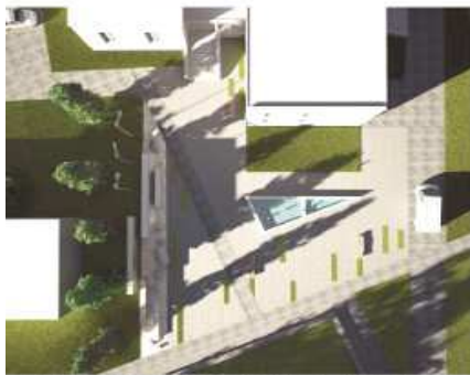
WIDOK WYWIERTY REPRZEDNIICZY