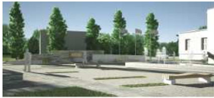
WIDOK WYWIERTY GŁÓWNE