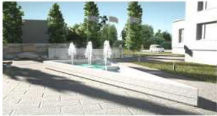
WIDOK WYWIERTY BOKOWY