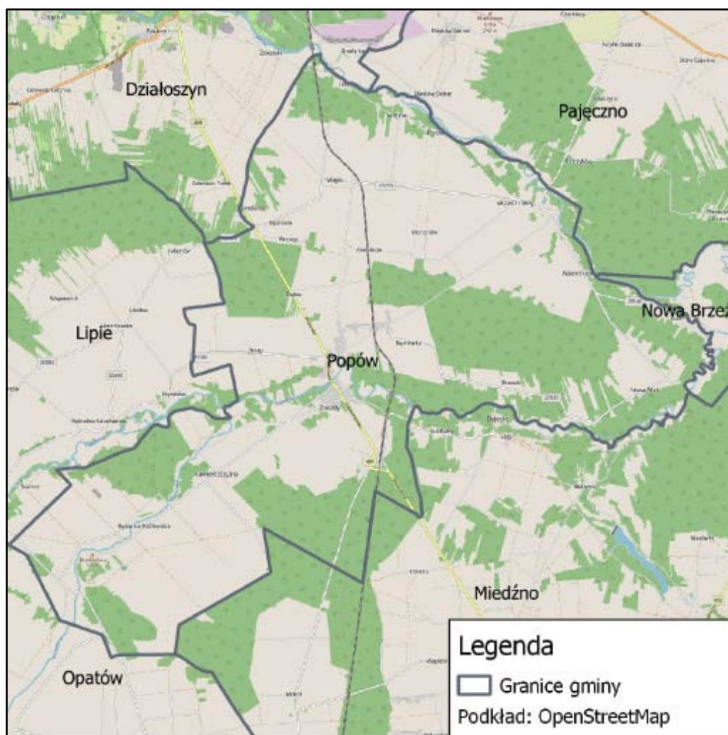
Rysunek 1 Mapa gminy Popów